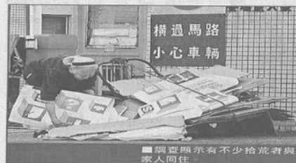
調查顯示有不少拾荒者與家人同住。