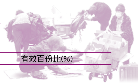
表八 受訪拾荒長者的生活情況