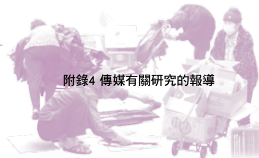
附錄4 傳媒有關研究的報導

社聯於2007年3月5日，舉行了新聞發佈會，初步介紹本研究的結果及建議，以下為翌日部份報章的報導：