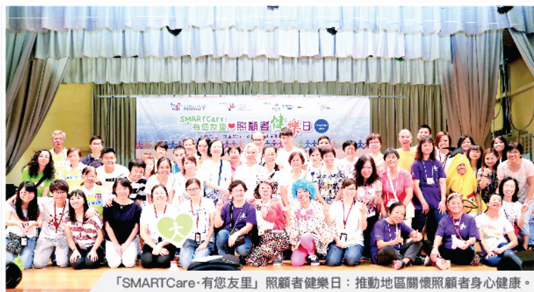
「SMARTCare·有您友里」照顧者健康日：推動地區關懷照顧者身心健康。