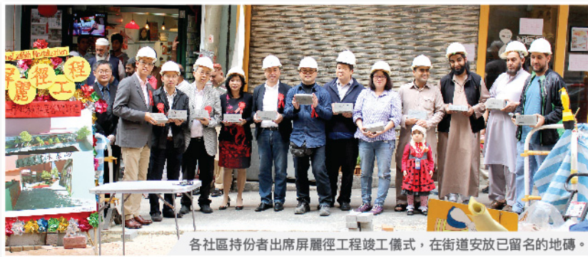
各社區持份者出席屏麗徑工程竣工儀式，在街道安放已留名的地磚。

計劃乃推動地區活化及文化共融的先導計劃，在為期兩年的計劃中，致力傳揚區內跨文化色彩，集中建立活化工程及文化傳承活動，鞏固葵涌屏麗徑一帶的跨種族社區文化精神。