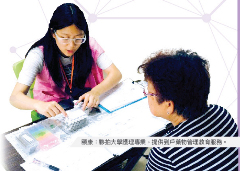
頤康：影拍大學護理專業，提供到戶藥物管理教育服務。