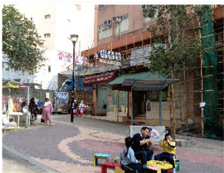
美化工程竣工後，不同國籍的遊人可使用屏麗徑的設施。