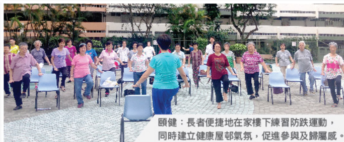
頤健：長者便捷地在家樓下練習防跌運動，同時建立健康屋邨氣氛，促進參與及歸屬感。