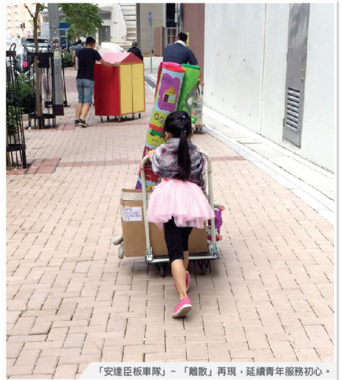
「安達臣板車隊」~「離散」再現，延續青年服務初心。