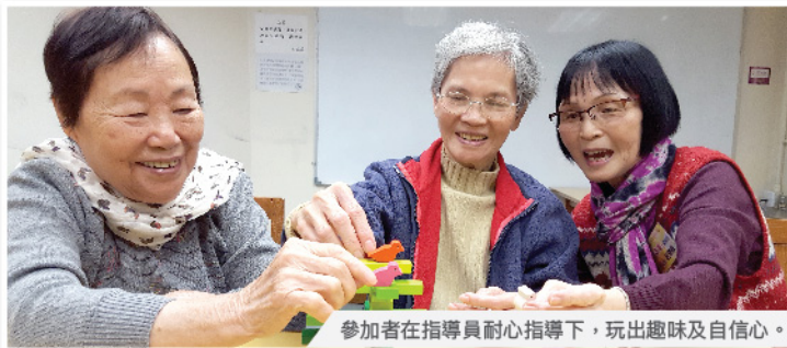
參加者在指導員耐心指導下，玩出趣味及自信心。