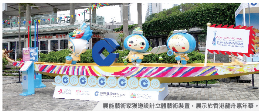
展能藝術家獲邀設計立體藝術裝置，展示於香港龍舟嘉年華。