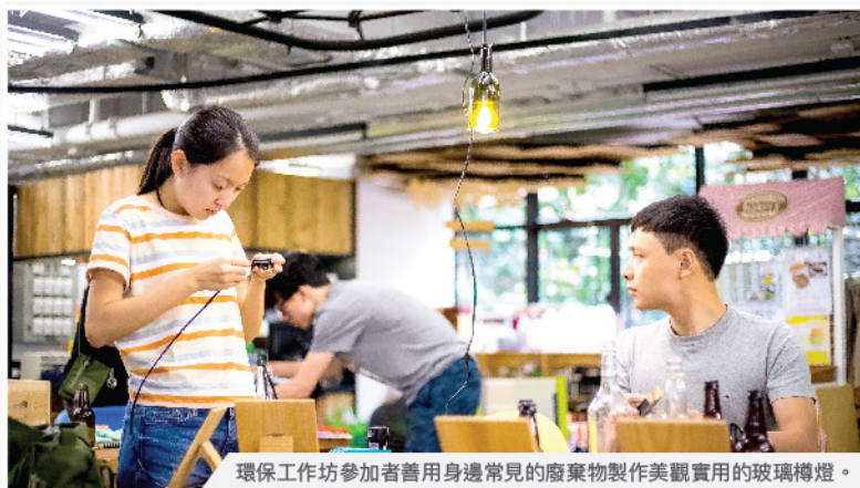
環保工作坊參加者善用身邊常見的廢棄物製作美觀實用的玻璃樽燈。