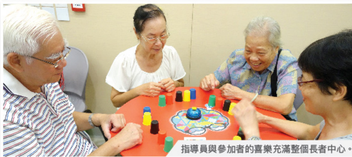
指導員與參加者的喜樂充滿整個長者中心。