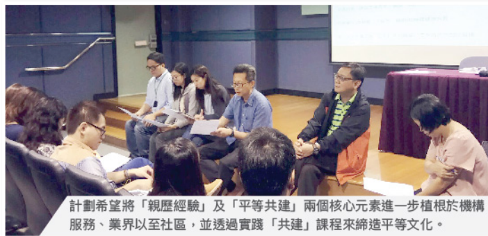
計劃希望將「親歷經驗」及「平等共建」兩個核心元素進一步植根於機構服務、業界以至社區，並透過實踐「共建」課程來締造平等文化。