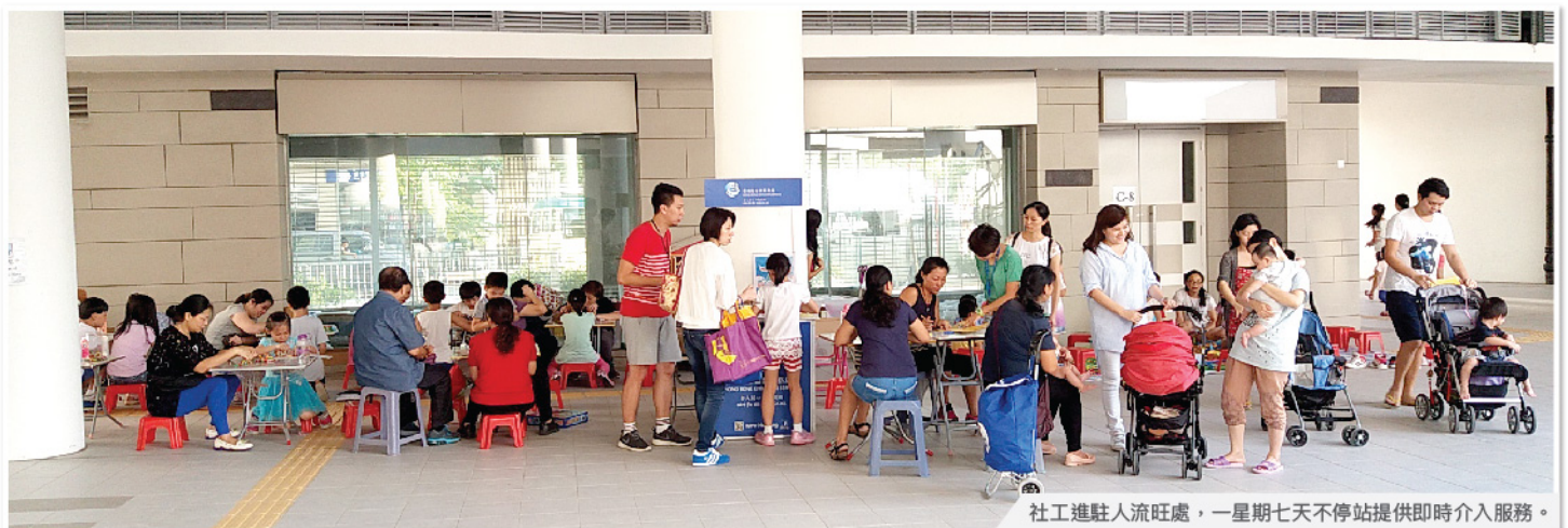
社工進駐人流旺盛，一星期七天不停站提供即時介入服務。