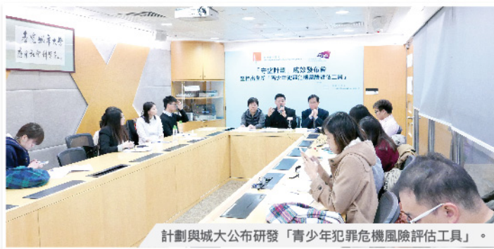
計劃與城大公布研發「青少年犯罪危機風險評估工具」。