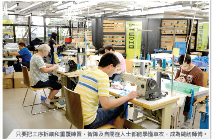
只要把工序拆細和重覆練習，智障及自閉症人士都能學懂車衣，成為縫紉師傅。