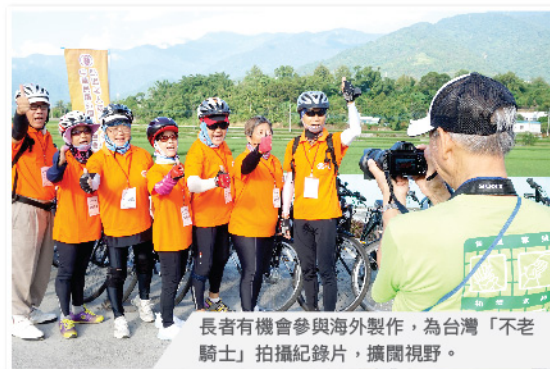
長者有機會參與海外製作，為台灣「不老騎士」拍攝紀錄片，擴闊視野。