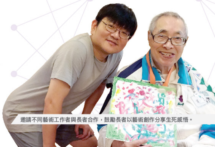
邀請不同藝術工作者與長者合作，鼓勵長者以藝術創作分享生死感悟。