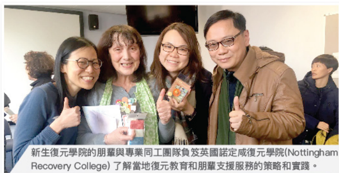
新生復元學院的朋輩與專業同工團隊負笈英國諾定咸復元學院(Nottingham Recovery College)了解當地復元教育和朋輩支援服務的策略和實踐。

一直以來，專業人士及公眾都傾向著眼於「疾病」及「缺損」來看待精神復元人士。在這不平等的關係和污名化下，復元人士被視為醫療及社會服務的長期「依賴者」。復元人士在經歷精神障礙的過程中，培養出許多智慧和經驗。復元學院期望透過教育平台和系統的培訓，將復元人士的親歷經驗，轉化為可供教學的知識，與專業人士的專長相配合，透過實踐「共建」課程來締造平等文化。