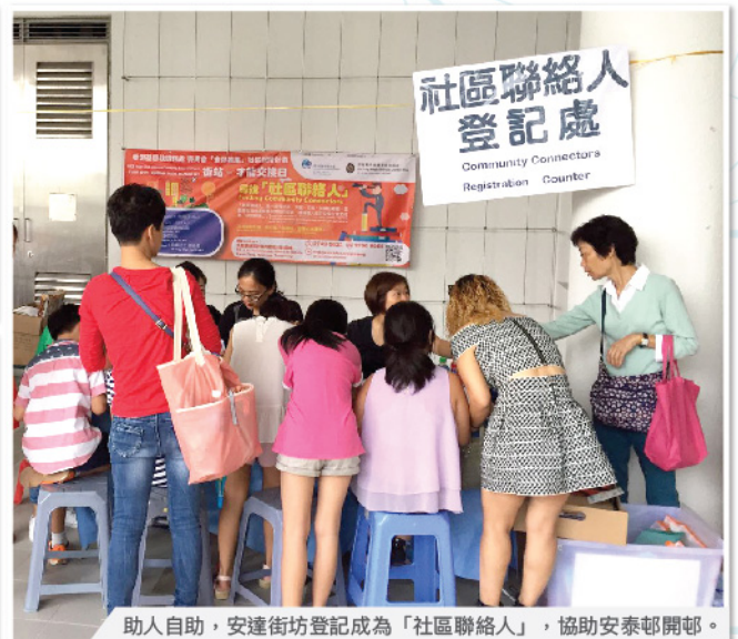
助人自助，安達街坊登記成為「社區聯絡人」，協助安泰邨開邨。