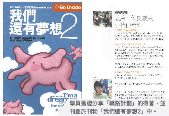
學員獲邀分享「職路計劃」的得著，並刊登於刊物「我們還有夢想2」中。