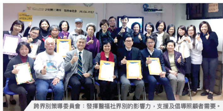
跨界別策導委員會：發揮醫福社界別的影响力，支援及倡導照顧者需要。