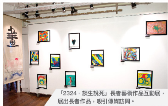
「2324·談生說死」長者藝術作品互動展，展出長者作品，吸引傳媒訪問。

以具治療元素之「多元藝術體驗」作介入，推行「家庭為本」社區生死教育及支援服務。鼓勵長者反思生死，與護老者溝通晚晴心願，鼓勵活得精彩，走得安心。