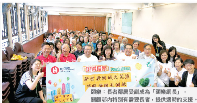
頤樂：長者鄰居受訓成為「頤樂網長」，關顧邨內特別有需要長者，提供適時的支援。