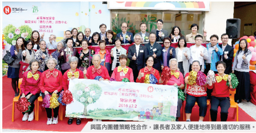
與區內團體策略性合作，讓長者及家人便捷地得到最適切的服務。