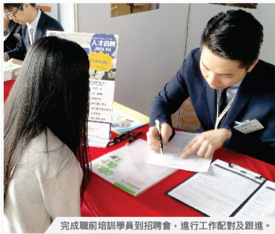
完成職前培訓學員到招聘會，進行工作配對及跟進。

近年生涯規劃及就業支援普及，可惜未有就SEN青年而設的相關支援。有見及此，2014年「職路計劃」整合了心理學實證理論，針對有學習困難人士的認字和空間感訓練，加入就業培訓項目中，以協助有學習困難的低動機青年建立一套成功的應對就業困難的技巧。