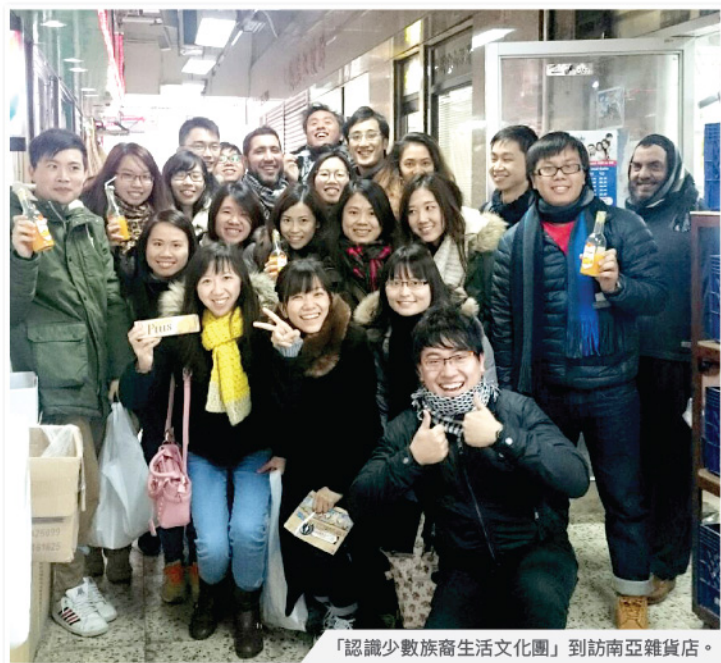
「認識少數族裔生活文化團」到訪南亞雜貨店。