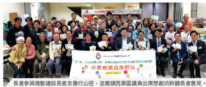
長者參與推動建設長者友善行山徑，並邀請西貢區議員出席想創坊聆聽長者意見。

服務對象及人數：退休人士/長者及社區人士；55位長者參加情意自然教育訓練；261位社區人士參加自然導賞活動；超過1,000位長者參與推動建設長者友善行山徑