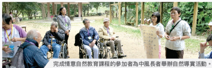
完成情意自然教育課程的參加者為中風長者舉辦自然導賞活動。

信任長者有發展的潛能和為自己生活作選擇的權利及能力，尊重長者有權參與決定社區的事務。機構希望藉著計劃讓退休人士及長者學習新知識，同時分享生活智慧，持續參與貢獻社區，發揮潛能，並推動逐步建立西貢長者友善社區。