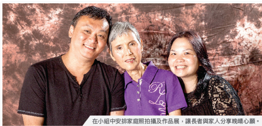
在小組中安排家庭照拍攝及作品展，讓長者與家人分享晚晴心願。