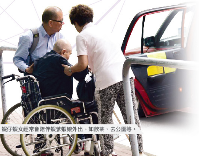
蝦仔蝦女經常會陪伴蝦爹蝦娘外出，如飲茶、去公園等。

計劃成功動員大量願意持續關懷、陪伴長者的義工。他們以信仰作為原動力，委身關顧。藉著培訓，將經驗分享，讓義工更明白持續關懷的方式。在過程中，他們彼此漸建立出一份情，使義工與長者的關係持續和持久。長者也因此對社區產生了信任，生命起了重新定位的意義，身心社靈得到更充分的滿足及盼望。計劃成功地啟發助人者及受助者對人對事的觀點，從而帶來發自內心的改變。