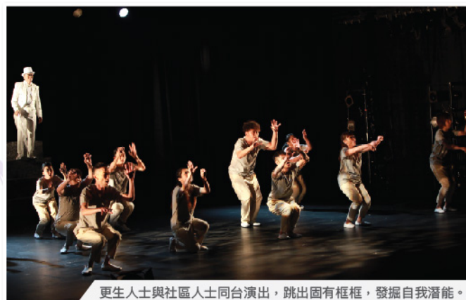
更生人士與社區人士同台演出，跳出固有框框，發掘自我潛能。

計劃希望透過戲劇帶引服務使用者窺見正向和豐盛的人生，提升正能量；亦推動社區參與，預防犯罪，建設和諧共融社會。