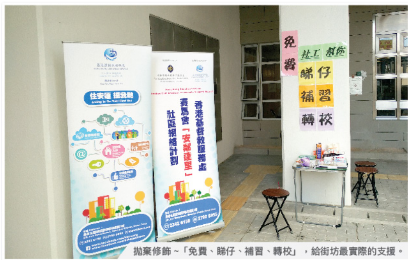
拋棄修飾~「免費、睇仔、補習、轉校」，給街坊最實際的支援。