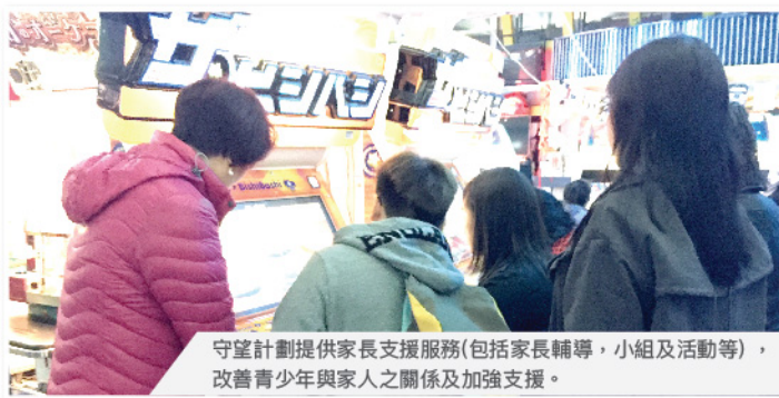
守望計劃提供家長支援服務(包括家長輔導，小組及活動等)，改善青少年與家人之關係及加強支援。