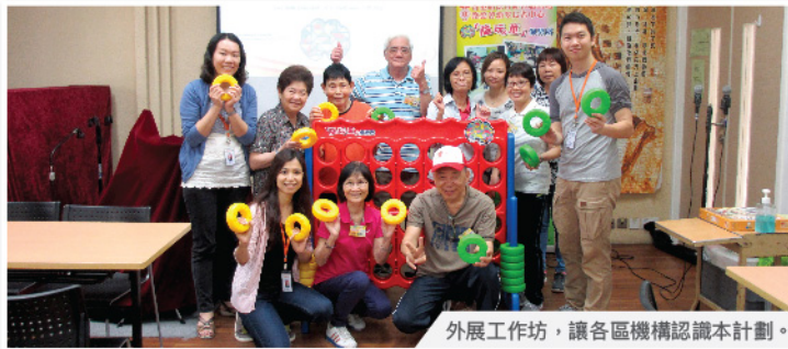
外展工作坊，讓各區機構認識本計劃。