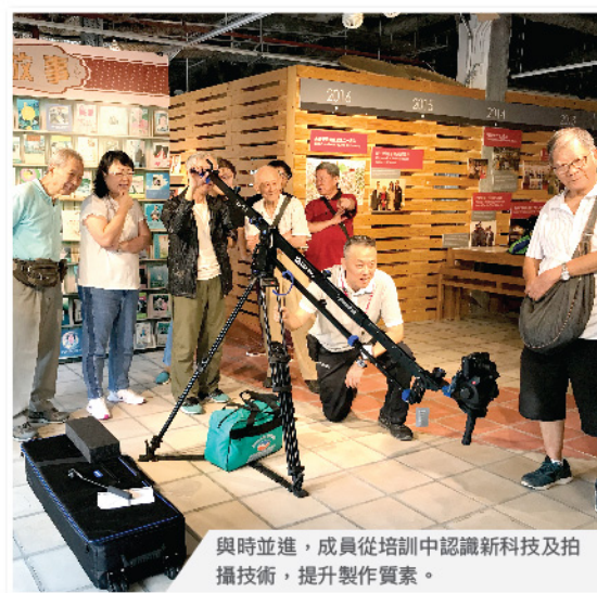
與時並進，成員從培訓中認識新科技及拍攝技術，提升製作質素。