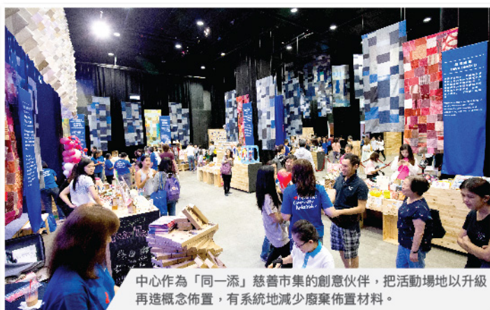
中心作為「同一添」慈善市集的創意伙伴，把活動場地以升級再造概念佈置，有系統地減少廢棄佈置材料。