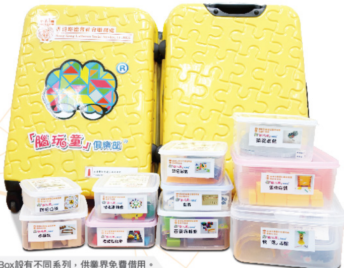
Fun Box設有不同系列，供業界免費借用。

傳統玩具以幼兒和年青人為主，玩法複雜，長者閱讀遊戲說明書有一定困難。故腦玩童俱樂部內每一份玩具均需訂造或改裝，以切合長者的需要。機構亦自行研發及銷售符合長者能力及需要的玩具。計劃與本地玩具設計師跨專業的合作，在設計過程中加入本土特色，亦將傳統文化承傳下去。另外，為使更多長者受惠，計劃亦提供外借玩具服務，免費供業界借用玩具，更有效運用資源。