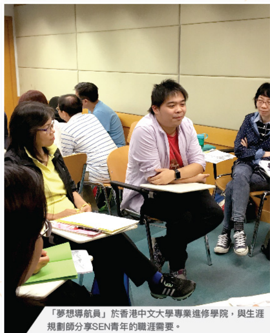
「夢想導航員」於香港中文大學專業進修學院，與生涯規劃師分享SEN青年的職涯需要。