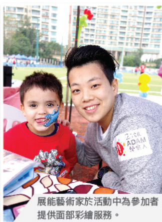
展能藝術家於活動中為參加者提供面部彩繪服務。

「藝全人」由香港展能藝術會所成立的社會企業，致力為香港的展能藝術家創造工作機會及收入來源，讓他們發揮視覺藝術及表演藝術的獨特才能，藉此增強他們的自我效能感和自信心，同時倡議社會大眾以新的角度欣賞不同能力人士的創造力，以藝術推動創意及社會共融。