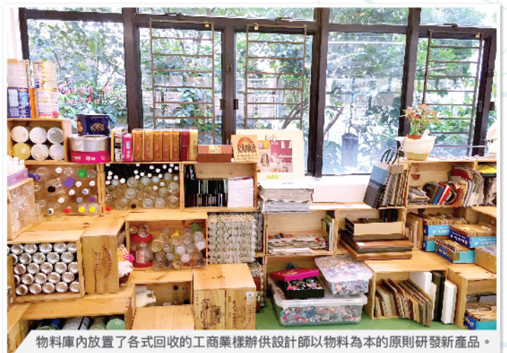
物料庫內放置了各式回收的工商業樣辦供設計師以物料為本的原則研發新產品。