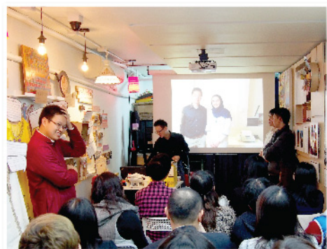
「伊朗文化旅遊」攝影展於共融館內分享伊朗旅遊點滴。