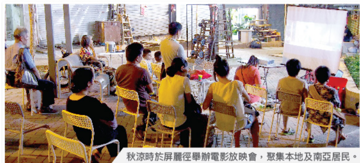
秋涼時於屏麗徑舉辦電影放映會，聚集本地及南亞居民。