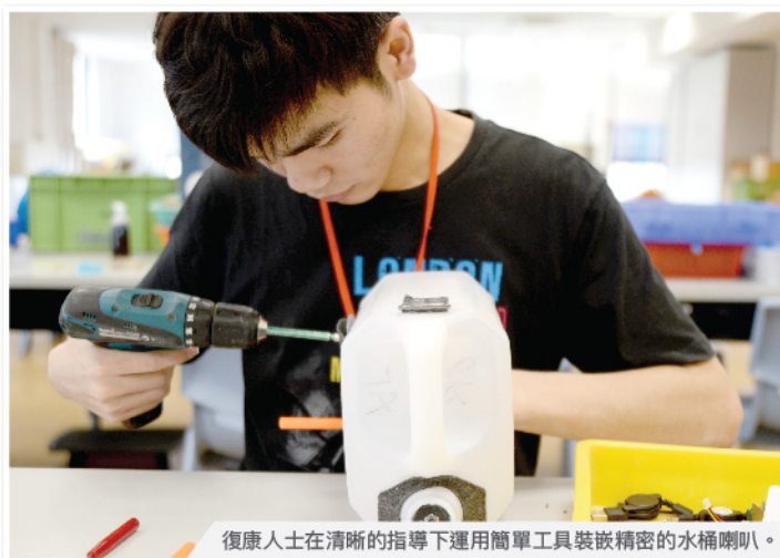
復康人士在清晰的指導下運用簡單工具裝嵌精密的水桶喇叭。