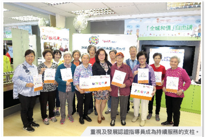
重視及發展認證指導員成為持續服務的支柱。