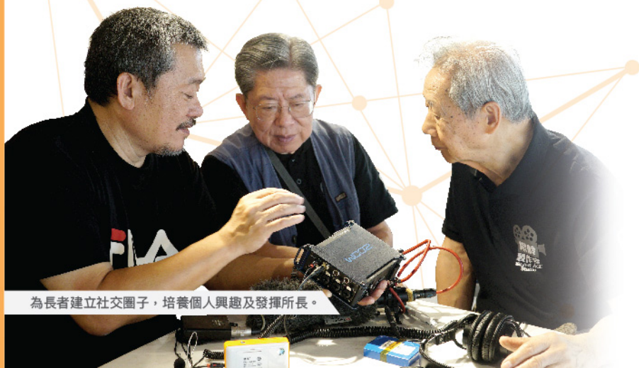
為長者建立社交圈子，培養個人興趣及發揮所長。