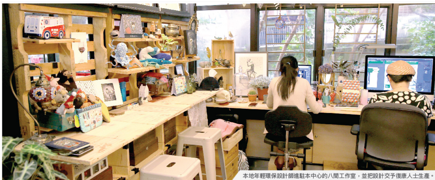
本地年輕環保設計師進駐本中心的八間工作室，並把設計交予復康人士生產。

中心以豐富復康人士的工作和生活體驗及推動環保教育工作為己任。一方面，駐中心的設計師善用企業和公眾大量捐贈的物料進行設計，過程中與復康人士緊密溝通和合作從而了解其強項，把復康人士的優勢於產品中展現，而復康人士則在專業團隊的輔助下完成各類升級再造產品的生產，同時亦擔任教育工作坊的導師和積極參展，使其自信和溝通能力得以提升之餘，更展現出他們的天賦與才能；另一方面，中心的推廣團隊在營銷過程中向企業及公眾消費者傳達環保責任消費的重要訊息，而訪客亦可透過參加中心的導賞團和選購產品，完整地見證一件升級再造產品由概念設計、物料選材、生產製作到推廣發售的誕生過程，積極投入綠色生活。