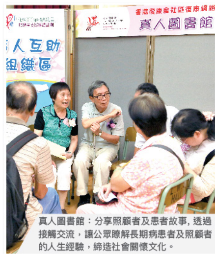
真人圖書館：分享照顧者及患者故事，透過接觸交流，讓公眾瞭解長期病患者及照顧者的人生經驗，締造社會關懷文化。