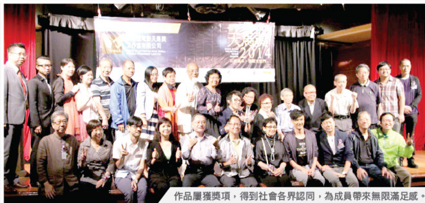
作品屢獲獎項，得到社會各界認同，為成員帶來無限滿足感。

隨著人口老化，在發達國家的同齡長者比以往更能維持活動能力及智力。透過具獨特性的「銀齡製作室」，將一班擁有共同興趣及夢想的退休長者集結，合力完成目標，建立自信心，肯定自我存在價值。藉著分享成果，獲得社會的認同及改變公眾對長者的負面看法。