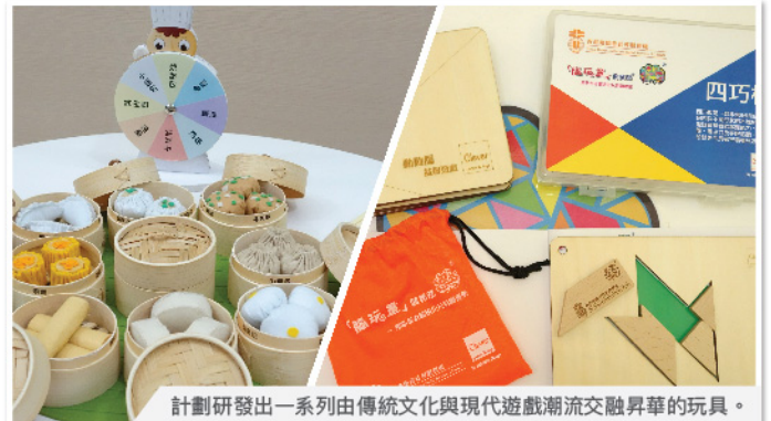
計劃研發出一系列由傳統文化與現代遊戲潮流交融昇華的玩具。