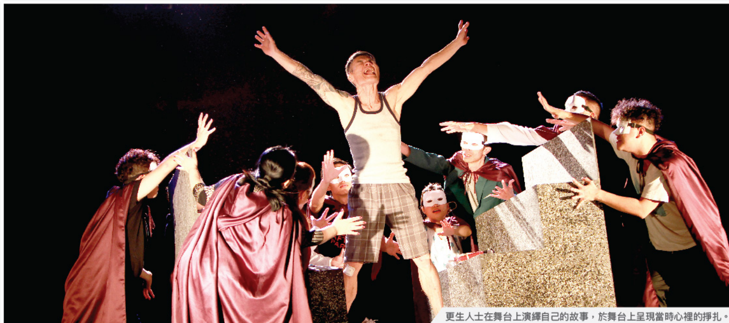
更生人士在舞台上演繹自己的故事，於舞台上呈現當時心裡的掙扎。

服務對象及人數：創團劇目「英雄本色」由7名更生人士/戒毒康復者及5名社區人士合演；三場演出共有1,076位觀眾