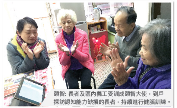
頤智：長者及區內義工受訓成頤智大使，到戶探訪認知能力缺損的長者，持續進行健腦訓練。