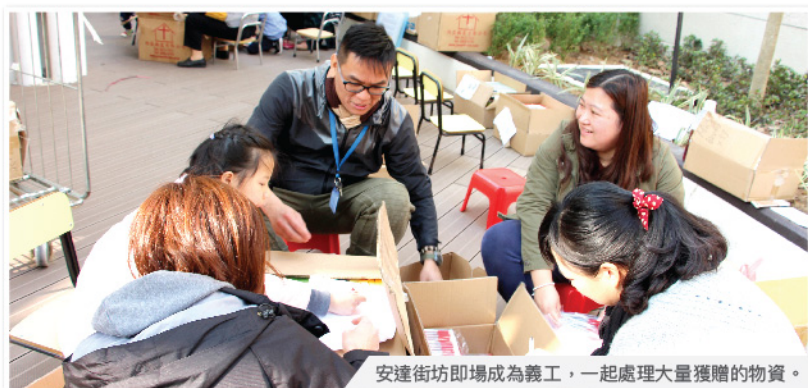
安達街坊即場成為義工，一起處理大量獲贈的物資。