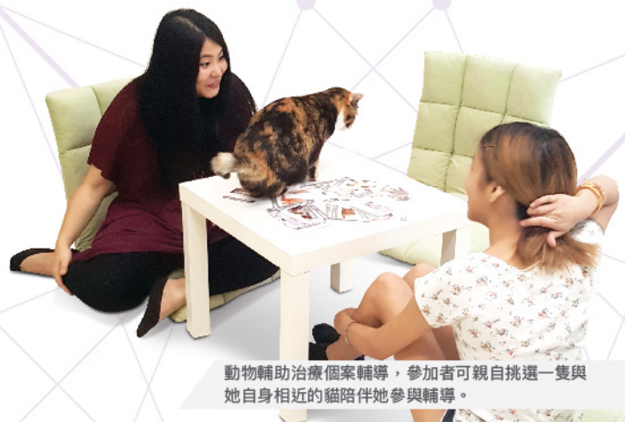
動物輔助治療個案輔導，參加者可親自挑選一隻與她自身相近的貓陪伴她參與輔導。

除了考慮服務使用者外，動物福利亦是最需要受關注的，貓治療室及活動的設計都以動物福利考慮為先。除了需要符合香港法例外，更需要照顧治療貓的安全和健康，建立一個舒適的居住環境。工作人員需要掌握動物的行為及情緒，確保治療貓/犬在沒有壓力的狀態下協助輔導。