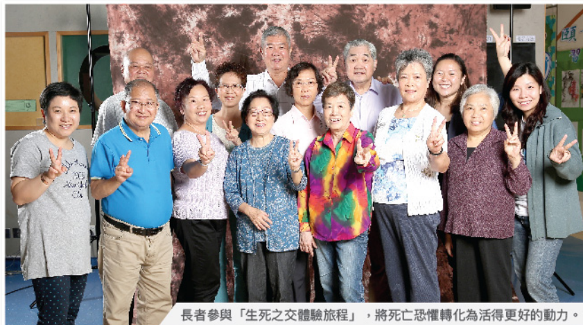
長者參與「生死之交體驗旅程」，將死亡恐懼轉化為活得更好的動力。

服務對象及人數：長者及護老者，服務超過300個護老家庭，總服務人次超過85,000人