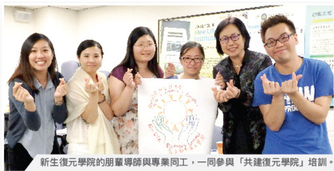
新生復元學院的朋輩導師與專業同工，一同參與「共建復元學院」培訓。