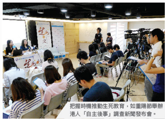
把握時機推動生死教育，如重陽節舉辦港人「自主後事」調查新聞發布會。