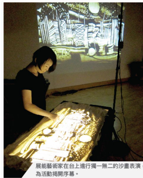
展能藝術家在台上進行獨一無二的沙畫表演，為活動揭開序幕。