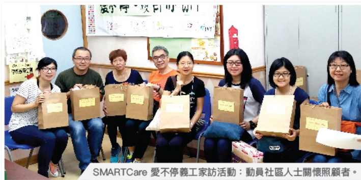
SMARTCare 愛不停義工家訪活動：動員社區人士關懷照顧者。