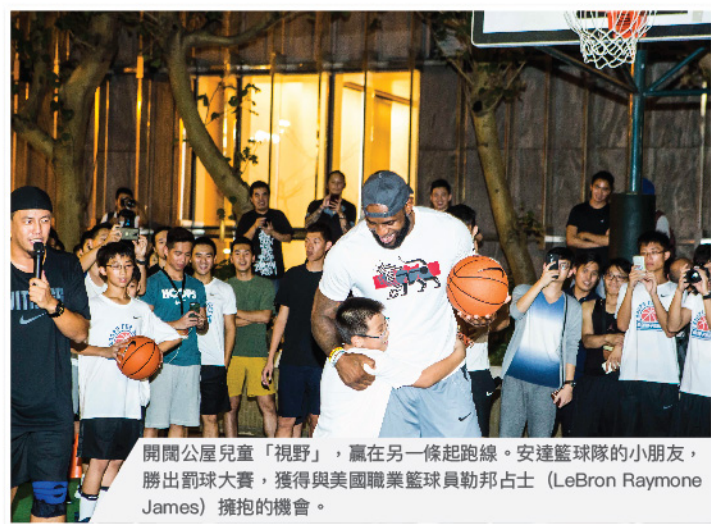
開闢屋童「視野」，贏在另一條起跑線。安達籃球隊的小朋友，勝出罰球大賽，獲得與美國職業籃球員勒邦占士 (LeBron Raymone James) 擁抱的機會。