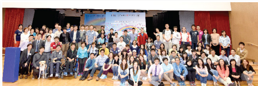
「職路計劃」與職業訓練局合辦「專業師友導向計劃」，有助僱主理解學員的就業能力。

服務對象及人數：17-29歲(預備入職)特殊教育需要(SEN)之青年，共180位參與服務，服務人次達9,450次