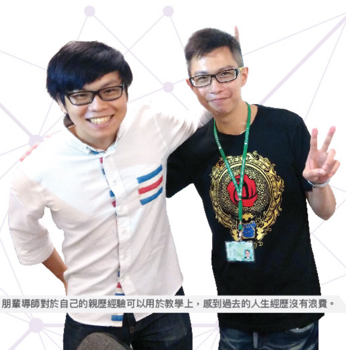
朋輩導師對於自己的親歷經驗可以用於教學上，感到過去的人生經歷沒有浪費。