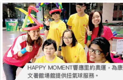
HAPPY MOMENT響應里約奧運，為康文書館場館提供扭氣球服務。