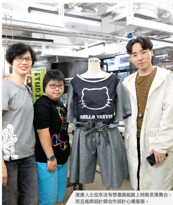
復康人士從來沒有想像過能踏上時裝表演舞台，而且能與設計師合作設計心儀服裝。

升級再造中心體現了設計、生產、復康、社工、市場學和環保的跨專業協作，結合創意和機器的配合所產生的強大協同效應，有效把升級再造的概念和復康人士的能力以高質素的产品具體呈現；超過10,000件產品成功售出乃社會人士對其卓越能力另眼相看和予以認同的實證。此外，整個產品設計及生產過程講求零浪費和物料為本，按照不同物料的特性，生產過程亦會出現各種變化和可能性，因而造就團隊吸納擁有不同工藝和知識的專才，為復康人士注入新的知識和技能，並製造機會讓他們與不同背景人士接觸，從而擴闊其眼界；而社會人士亦能通過接觸，真切地了解復康人士，達至共融。