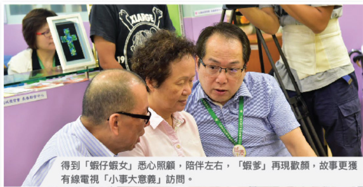
得到「蝦仔蝦女」悉心照顧，陪伴左右，「蝦爹」再現歡顏，故事更獲有線電視「小事大意義」訪問。