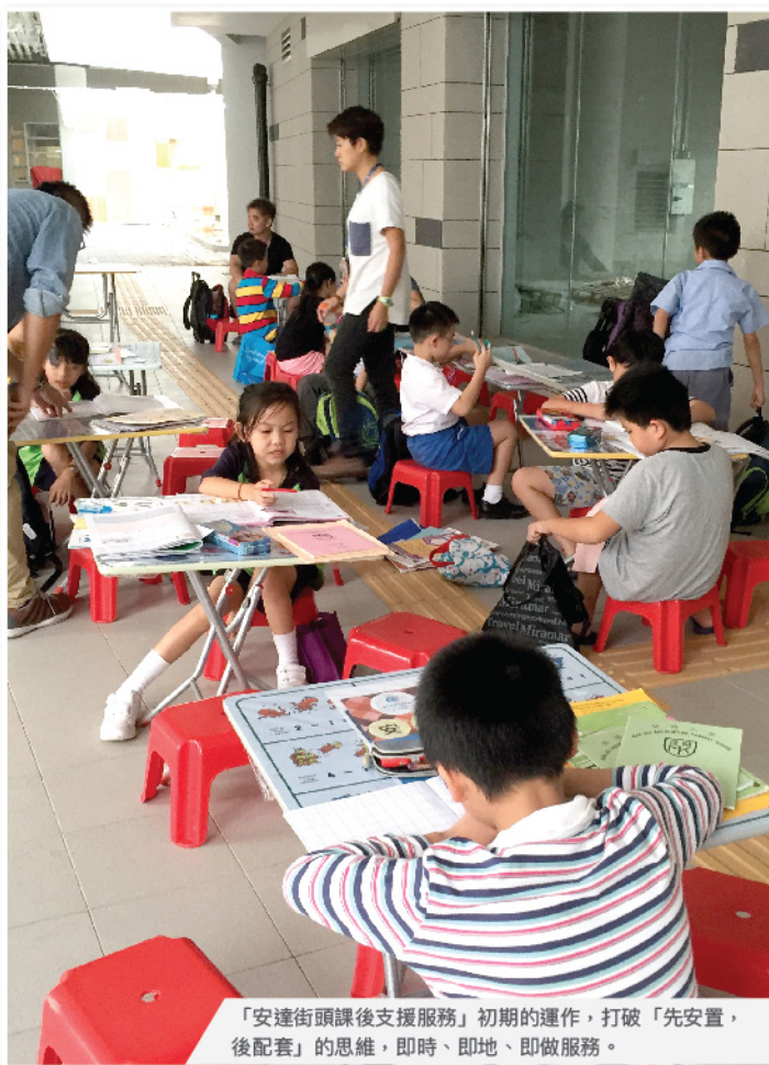
「安達街頭課後支援服務」初期的運作，打破「先安置、後配套」的思維，即時、即地、即做服務。

計劃焦點於發掘、發揮及發展街坊的強項及技能，組成一個「社區聯絡人」平台，更有效地把潛藏的社區資本回饋於新社區。當中以運用其強項而非問題導向，更使整個支援方式在無負面標籤的形態下使街坊可助己助人，形成一個強大的互助網。