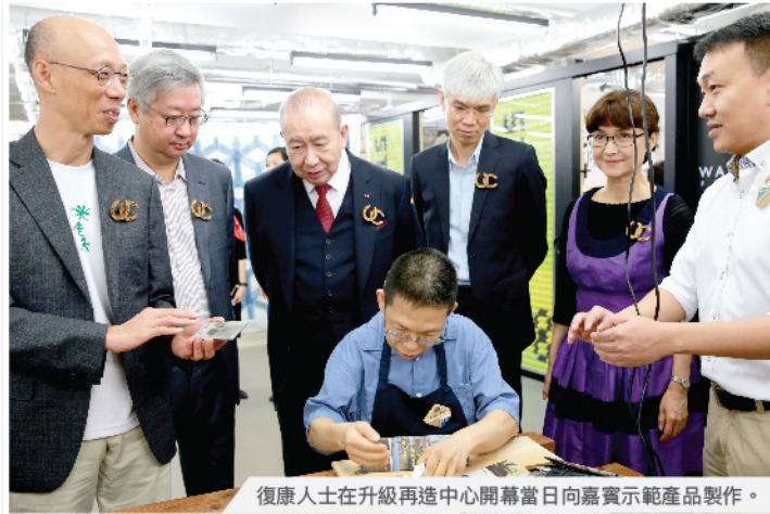
復康人士在升級再造中心開幕當日向嘉賓示範產品製作。

在「環保」及「循環再造」的新趨勢下，機構於2015年成立全港首間升級再造中心。透過升級再造中心凝聚不同背景的專業人士與復康人士協作，發揮復康人士高度專注的能力和獨特美學觀念等優勢，成就環保與關愛的結合；從而改變社會人士對環保的看法，亦為復康人士創造多元化的工作機會和體驗。