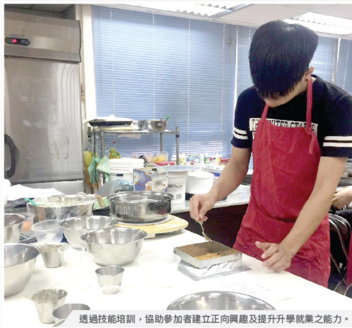
透過技能培訓，協助參加者建立正向興趣及提升升學就業之能力。

「守望計劃」中的「守望」指「守法」與「希望」，寓意一群違法青少年在危機中明白「守法」的重要性，在人生路途中尋著「希望」。計劃包含三個「3R」核心元素：(1)理性思維 (Rational Thinking)；(2)理性和合法行為 (Rational Behaviour)；以及(3)重新聯繫 (Re-connection)，重點在於協助被捕青少年與家庭、社區、學校及工作重新聯繫，強化守法意識及促進成長，達致停止重覆犯罪的危機。