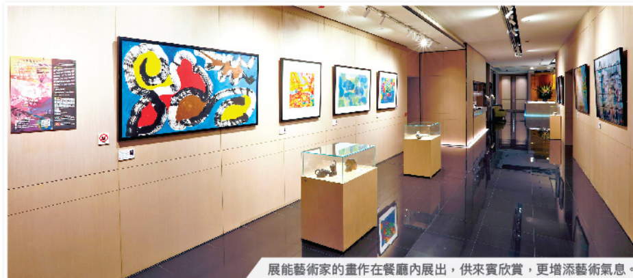
展能藝術家的畫作在餐廳內展出，供來賓欣賞，更增添藝術氣息。