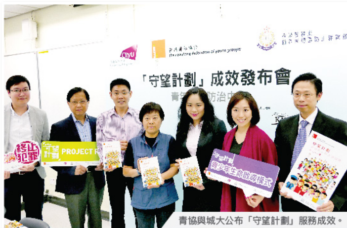
青協與城大公布「守望計劃」服務成效。