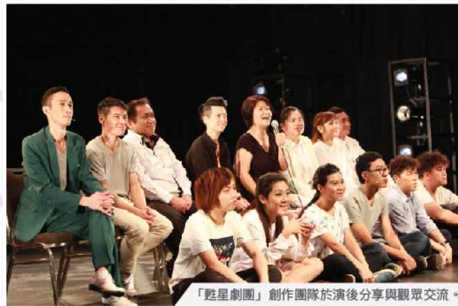
「甦星劇團」創作團隊於演後分享與觀眾交流。