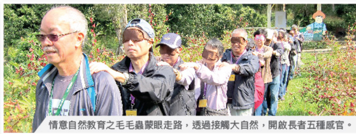
情意自然教育之毛毛蟲蒙眼走路，透過接觸大自然，開啟長者五種感官。