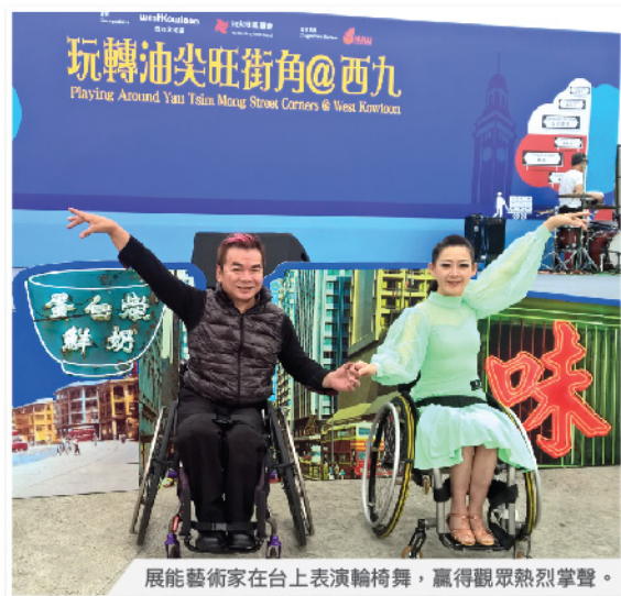
展能藝術家在台上表演輪椅舞，贏得觀眾熱烈掌聲。