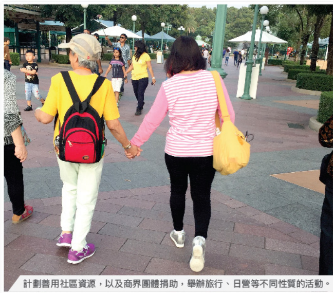
計劃善用社區資源，以及商界團體捐助，舉辦旅行、日營等不同性質的活動。