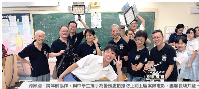
跨界別、跨年齡協作，與中學生攜手為警務處拍攝防止網上騙案微電影，盡顯長幼共融。