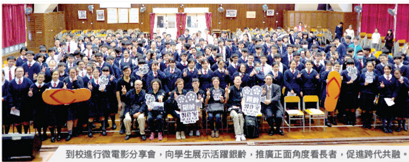
到校進行微電影分享會，向學生展示活躍銀齡，推廣正面角度看長者，促進跨代共融。