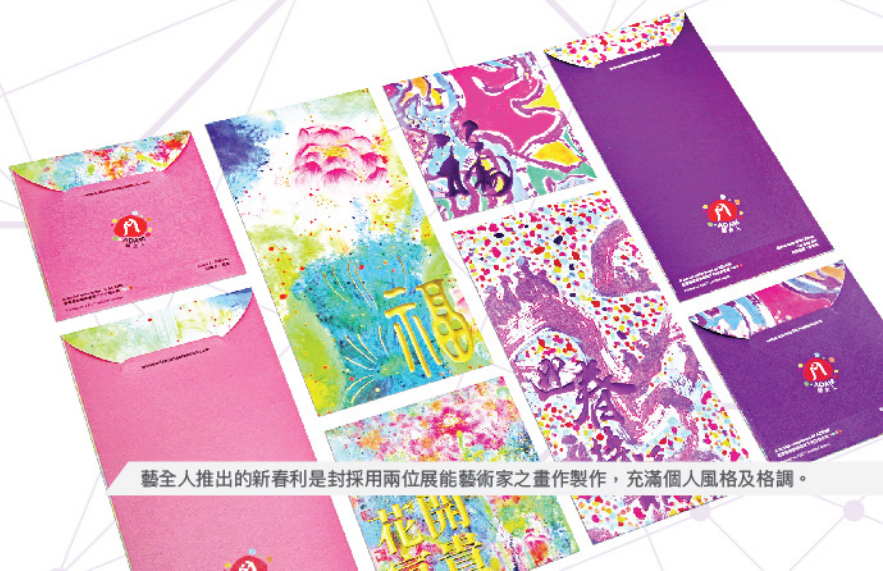
藝全人推出的新春利是封採用兩位展能藝術家之畫作製作，充滿個人風格及格調。