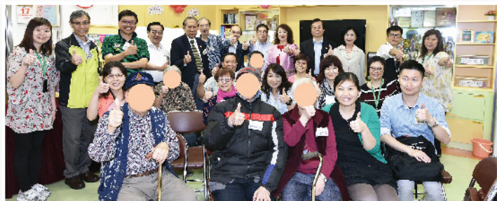
計劃推展至今，由第一屆的61位義工，增加至第三屆共106位義工參與。