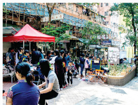
在屏麗徑舉辦墟市，凝聚葵涌區內外的居民與藝術單位。