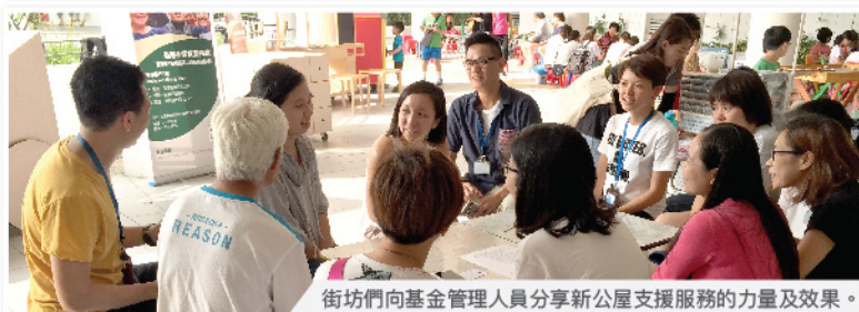
街坊們向基金管理人員分享新公屋支援服務的力量及效果。