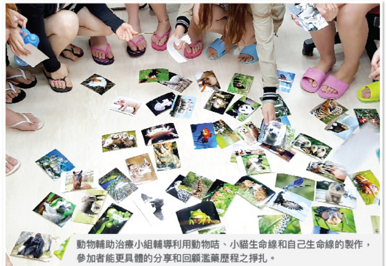
動物輔助治療小組輔導利用動物咭、小貓生命線和自己生命線的製作，參加者能更具體的分享和回顧濫藥歷程之掙扎。

3.與貓同行： 包括(1)為資源缺乏的流浪貓狗舍提供義工服務；(2)到街上拯救流浪貓；(3)小貓照顧計劃；及(4)與治療貓配對。如參加者生活狀況較穩定，家居環境適合飼養貓，亦建立了責任感及照顧貓的能力，她們可領養合適的治療貓回家，讓小貓的生命走進治療參加者的生命，小貓成為同行者，互相支持走日後的路。