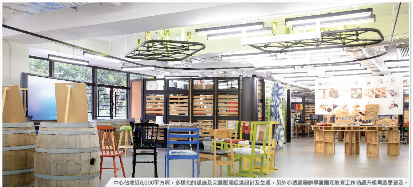
中心佔地近6,000平方呎，多樣化的設施及完善配套促進設計及生產，另外亦透過舉辦導賞團和教育工作坊讓升級再造更普及。