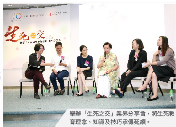
舉辦「生死之交」業界分享會，將生死教育理念、知識及技巧承傳延續。