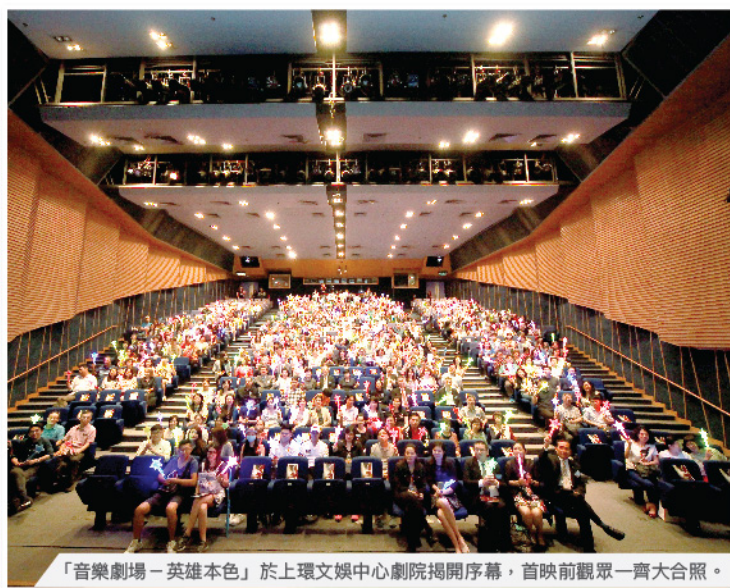
「音樂劇場－英雄本色」於上環文娛中心劇院揭開序幕，首映前觀眾一齊大合照。