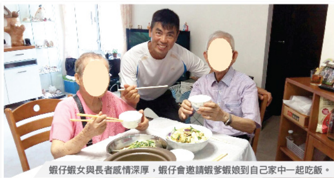
蝦仔蝦女與長者感情深厚，蝦仔會邀請蝦爹蝦娘到自己家中一起吃飯。