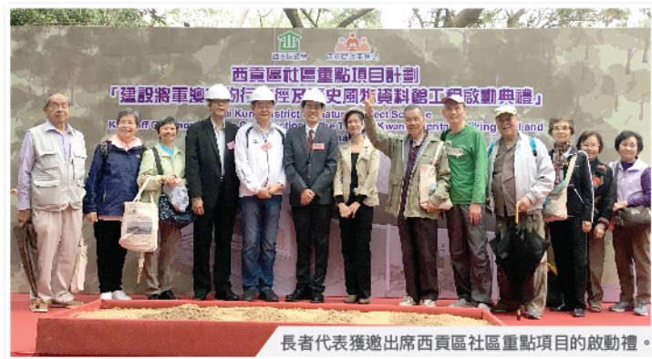
長者代表獲邀出席西貢區社區重點項目的啟典禮。