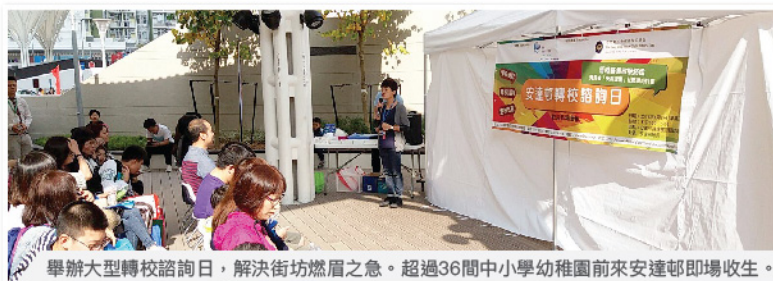
舉辦大型轉校諮詢日，解決街坊燃眉之急。超過36間中小學幼稚園前來安達邨即場收生。