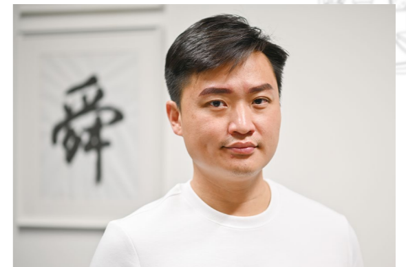
立法會議員 鄭泳舜