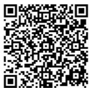
劏房租金水平 參考站 (Beta) 網頁