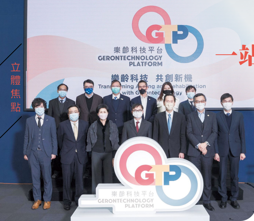
樂齡科技平台於 2021 年 12 月舉行啟動禮，由香港特別行政區創新及科技局副局長鍾偉強博士（前排中）以署理局長身份擔任主禮嘉賓，與社聯主席陳智思先生（前排右三）、社創基金專責小組主席李正義博士（前排左三）及樂齡科技平台合作聯盟成員合照。