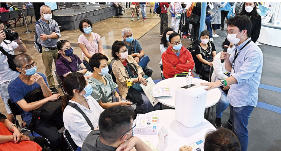
公眾參與其中一節 Kindo 產品測試活動，並積極發表意見。